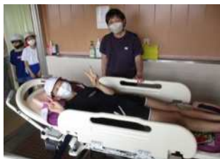
車いすや特殊浴を体験して、施設での生活を学ぶ皆さん。