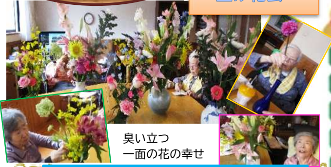
臭い立つ 一面の花の幸せ