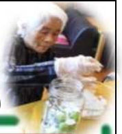
今年も 梅シロップ作り