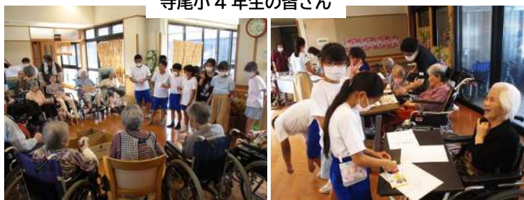
寺尾小4年生の皆さん