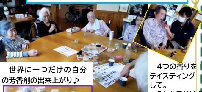
世界に一つだけの自分 の芳香剤の出来上がり♪