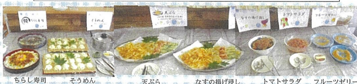
ちらし寿司 そうめん 天ぷら なすの揚げ浸し トマトサラダ フルーツゼリー