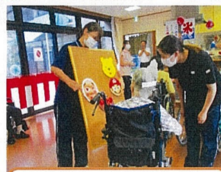
お面屋もあり、皆さん悩み選んで、笑顔が溢れていました