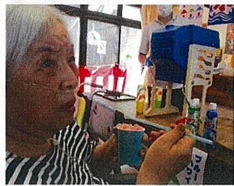
〈かき米〉様々なシロップから選んでかけてもらいました