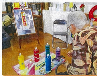
〈輪投げ〉狙いを定め高得点！

コロナ禍の中、入居者の皆様に暑い夏は楽しい夏祭りてひと時を過ごしていただきたい想いから、職員一同アイデアを出し合いながら、昔ながらの縁日の雰囲気味わえる「ミニ夏祭り」を開催しました。