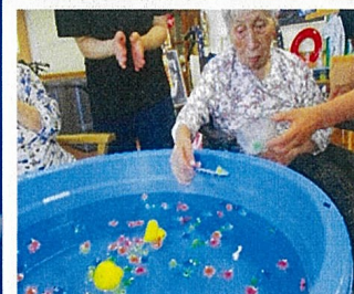
〈金魚すくい〉水の流れる音を聞きながら涼しさを感じていました