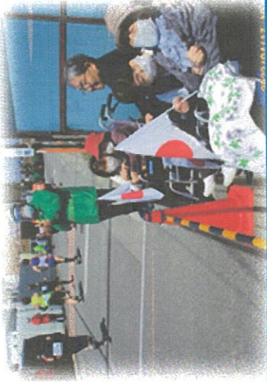
4月17日 長野マラソンの応援へ