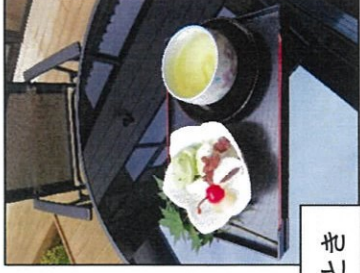
サルスベリの花を眺めながらのひととき