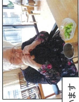
自分たちで育てた野菜はひと味違います