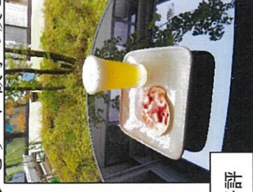
管理栄養士提案メニューは毎回大好評