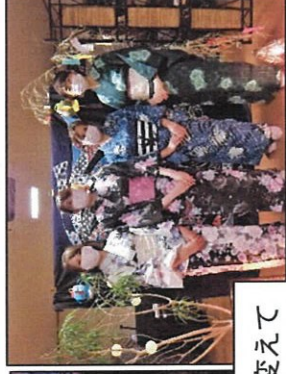
夕食後の楽しみをいつもと雰囲気を変えて