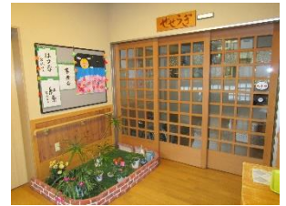
玄関にもお花を飾っています♪

食事のあとはソファでテレビを観たり、一休みしたり、こたつでは何人かで集まってお話ししたり、一人ひとりが自分らしく過ごしてもらえるようにしています。