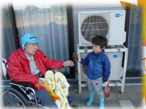
見てよ！大きいお芋が取れた！