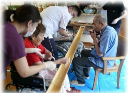
流しそうめん、夏の訪れ

これからも、いきいきでは利用されている方々が楽しめる活動を提供していきたいと思っております。